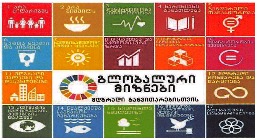
დიაგრამა 1. მდგრადი განვითარების მიზნები

ზემოაღნიშნულიდან გამომდინარე, SDG-ები აერთიანებს საკითხების ფართო და ყოვლისმომცველ სპექტრს. ისინი სხვა მნიშვნელოვან საკითხებთან ერთად, მიზნად ისახავს სიღარიბისა და შიმშილის აღმოფხვრას, უთანასწორობის შემცირებას, მშვიდობიანი, სამართლიანი საზოგადოებების მშენებლობას, გენდერული თანასწორობის უზრუნველყოფასა და ბუნებრივი რესურსების დაცვას.