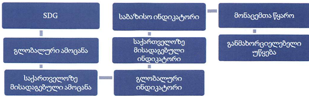
დიაგრამა 5. SDG-ების მატრიცის კომპონენტები