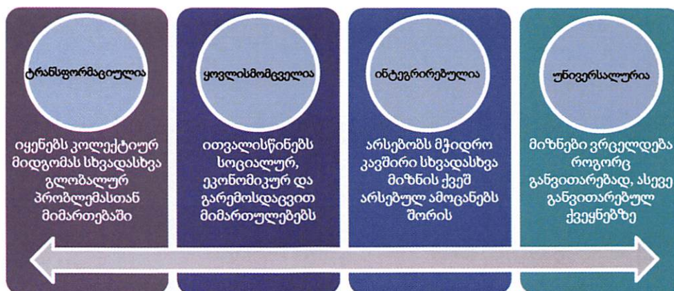
დიაგრამა 3. ძირითადი განსხვავებები SDG-ებსა და MDG-ებს შორის

2015 წლის სექტემბერში SDG-ების ეროვნულ კონტექსტში ინტეგრირებასა და 2030 წლისათვის განხორციელებასთან დაკავშირებით მზადყოფნა გამოხატა გაეროს წევრმა 193-მა ქვეყანამ, მათ შორის, საქართველომ.