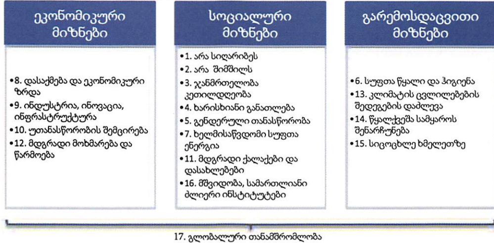
დიაგრამა 2. SDG-ების კლასიფიკაცია მიმართულებების მიხედვით

SDG-ები ათასწლეულის განვითარების მიზნებს (Millennium Development Goals - MDGs) ეფუძნება, რომელთა შესრულება 2000-2015 წლებში იყო დაგეგმილი. MDG-ები აერთიანებდა 8 კონკრეტულ მიზანს და სხვა მნიშვნელოვან საკითხებთან ერთად, ემსახურებოდა სიღარიბისა და შიმშილის აღმოფხვრას, პირველადი განათლების ხელმისაწვდომობას, გენდერული უთანასწორობისა და ბავშვთა სიკვდილიანობის შემცირებას. აღნიშნული მიზნების განხორციელების პროცესში, გაეროს სხვა ქვეყნებთან ერთად, საქართველოც იყო ჩართული.